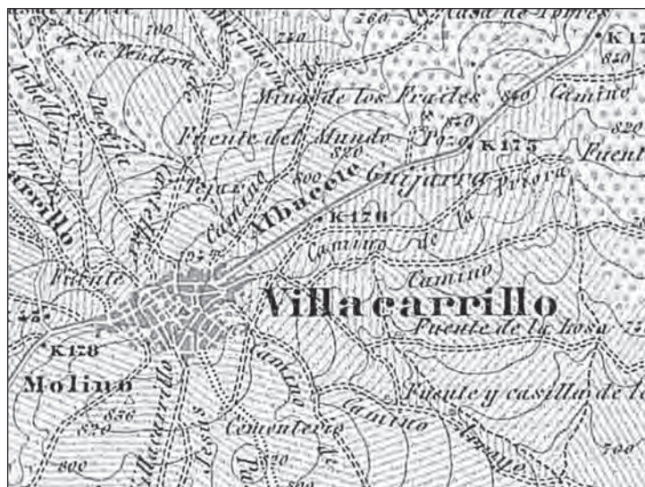
Extracto de plano donde se sitúa la Mina de los Frailes (año 1899)

En los últimos años, algunos de los objetivos principales del Club, han sido la colaboración en diversas actividades subterráneas, tales como el catálogo de fuentes y manantiales de Andalucía en colaboración con la Universidad de Granada y el Instituto Andaluz del Agua de la Junta de Andalucía, el inventariado de las minas de Villacarrillo y la ayuda a la investigación sobre la historia de nuestro municipio. Todo ello unido nos ha dado pie al descubrimiento y exploración de la Mina de los Frailes, un manantial cercano a la localidad y que históricamente ha sido muy importante para Villacarrillo.